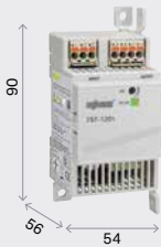
787-1201 2,5 A