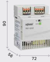
787-1212 2,5 A