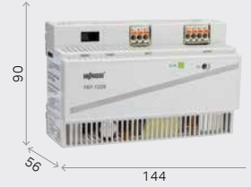
787-1226 6 A