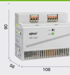
787-1221 8 A