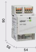
787-1202 1,3 A