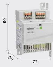
787-1211 5 A