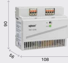
787-1216 4,2 A